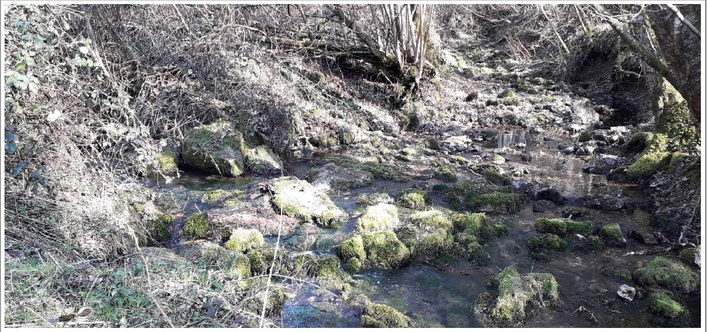
Confluence de La Noxe et du Ruisseau des Eglots à sec le 3 mars 2023

En période de fortes pluies, le trop-plein de ce gouffre s'écoule en aval dans le Ruisseau des Eglots, passe par la fosse Deulin (n°6) qui est aussi un gouffre, et devient un affluent temporaire de la Noxe avec sa confluence située à 50m de sa source (n°10). Reprendre le schéma dans Nouvelles de Nesle n°24.