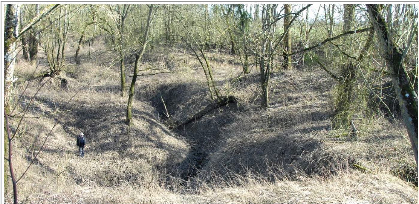
Gouffre des Eglots à sec le 27 février 2023

Déception, les Eglots à sec nous font découvrir un fond de gouffre pierré, ne pouvant donc pas avaler le cheval et sa charrette. La supposition du réseau souterrain qui alimenterait la Fontaine Vaunoise était à revoir. Heureusement pour nous Nigelloises, Nigellois et pour toute la vallée de la Noxe, même si le gouffre des Eglots est à sec, la source de la Noxe, elle, coule toujours.