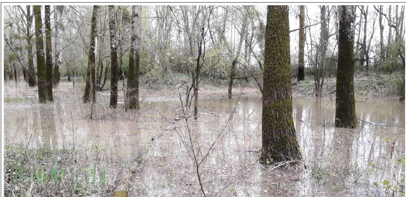
Gouffre des Eglots en pleine eau le 12.04.23