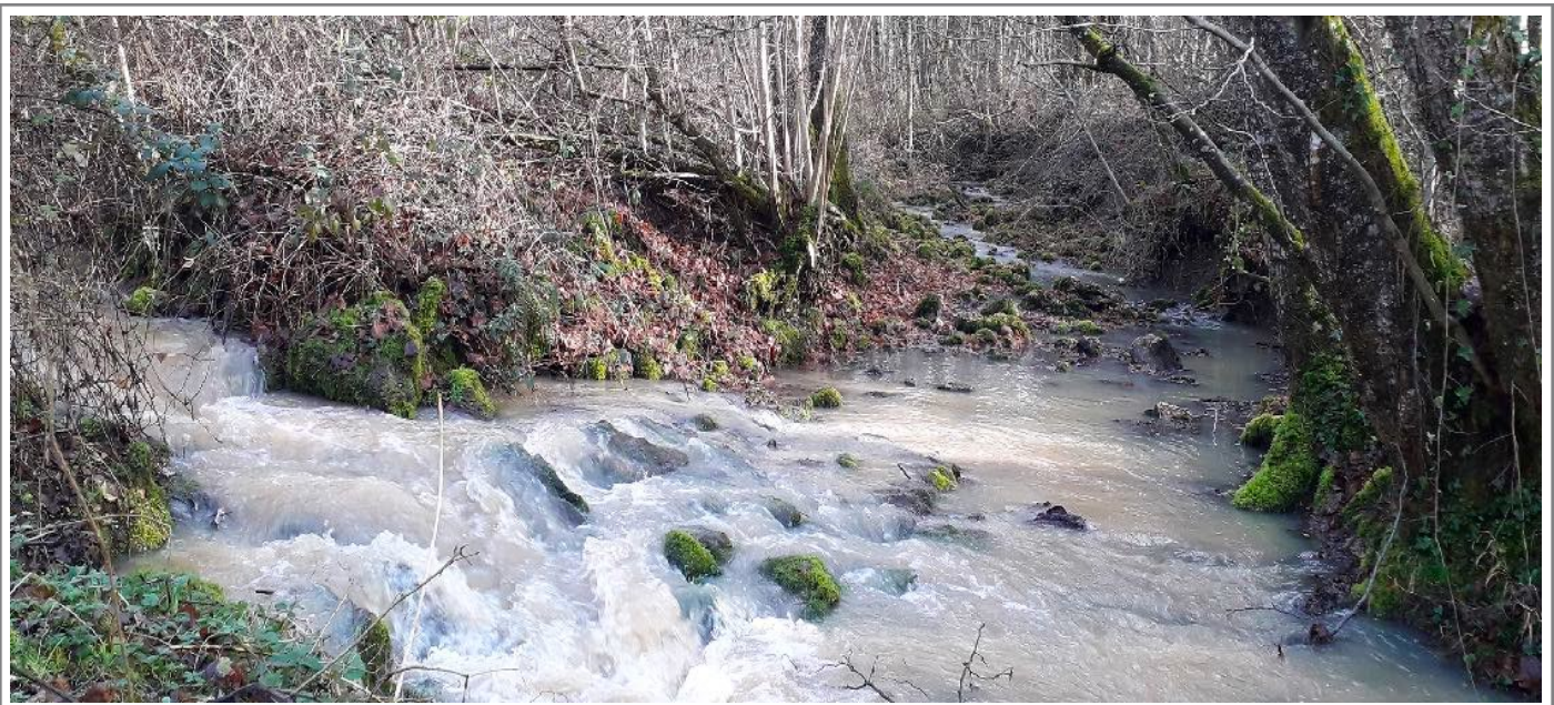
Confluence de la Noxe et du Ruisseau des Eglots par fortes pluies

En période de fortes pluies, le trop-plein de ce gouffre s'écoule en aval dans le Ruisseau des Eglots, passe par la fosse Deulin (n°6) qui est aussi un gouffre, et devient un affluent temporaire de la Noxe avec sa confluence située à 50m de sa source (n°10). Reprendre le schéma dans Nouvelles de Nesle n°24.